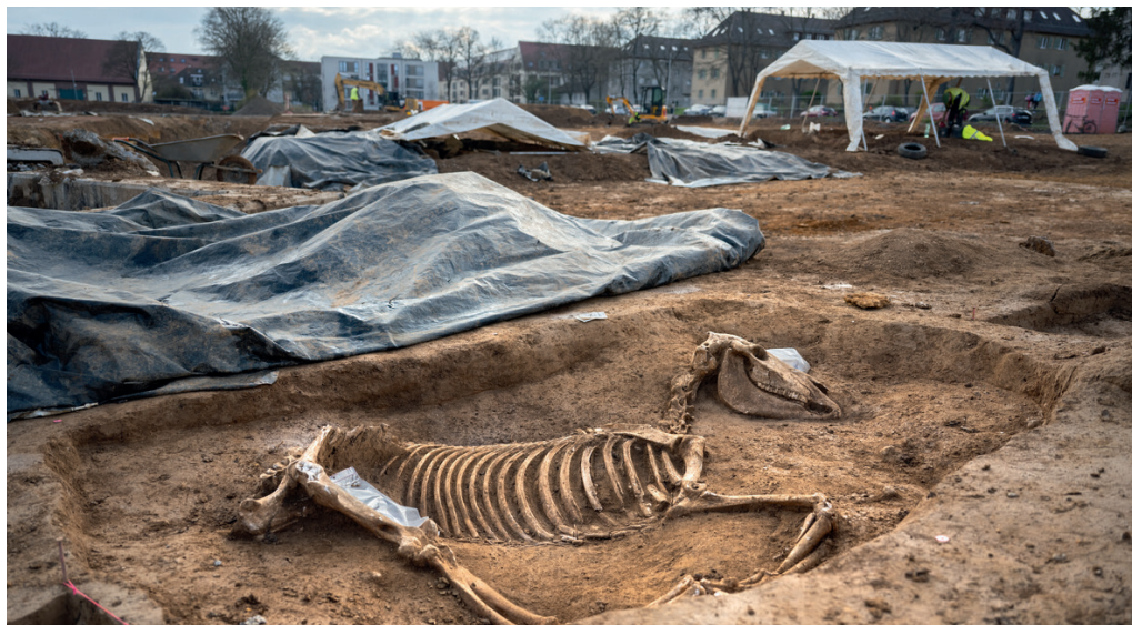
Archäologische Grabungen Hallschlag.

Ihre Stadtteilzeitung für den Hallschlag und Umgebung