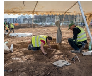
Archäologische Grabungen Hallschlag.

Die Pferde – so berichten die Fachleute – starben meist bei Übungen der Reitereinheiten oder wurden nach Verletzungen getötet. Nur selten deuten Grabbeigaben auf eine besondere Bindung zwischen Mensch und Tier hin. Mit großer Sorgfalt und Leidenschaft legt das Grabungsteam Skelette und Artefakte frei, dokumentiert sie und übergibt sie zur weiteren Untersuchung an das Zentrale Fundarchiv in Rastatt. Bereits in den 1920er Jahren wurden im Hallschlag Pferdeskelette gefunden, einige davon sind heute im Rosensteinmuseum zu sehen.