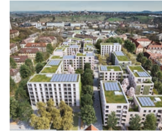
Wohnhöfe am Römerkastell

Steingebäude mit römischer Fußbodenheizung und Wandmalereien gefunden. Diese Entdeckung lässt darauf schließen, dass hier einst eine größere und wohlhabendere Siedlung existierte als bislang angenommen.