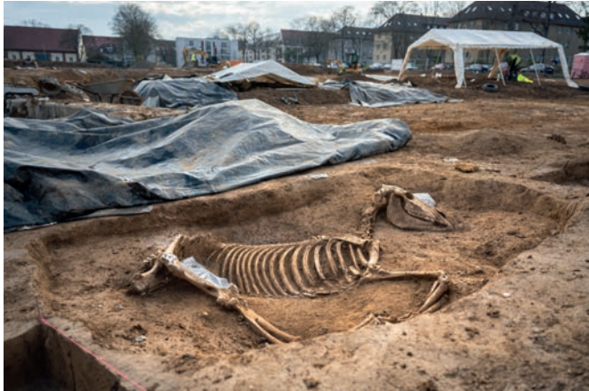
Archäologische Grabungen Hallschlag.

Wer im Hallschlag wohnt, lebt auf historischem Boden: Bevor die SWSG hier ein Neubauprojekt startet, betreten stets zuerst die Archäologinnen und Archäologen das Gelände – erst danach rollen die Bagger an.